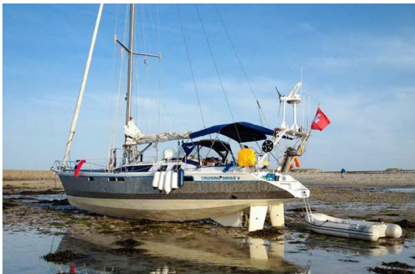
Trockenfallen üben: Die Cruising Swiss V, eine Ovni 455 kann das.