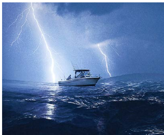
So ähnlich ging's uns auch.