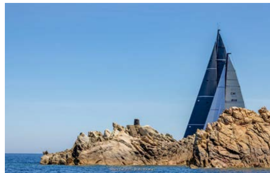
Unser Boot, erkennbar an dem blauen Segel, an einem Felsen als Bahnmarke. Es täuscht, wir führen.

Am zweiten Regattatag lief es solide, auch wenn sich das Ergebnis des Vortags nicht wiederholen