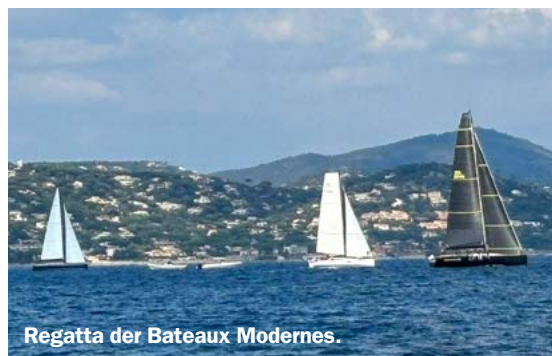
Regatta der Bateaux Modernes.