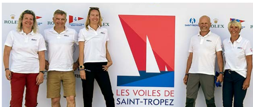
Unsere Mannschaft, bereit zum Race.

Zum dritten Mal hat eine Crew von CCS-Mitgliedern mit einem Performance Cruiser Ende September und anfangs Oktober 2025 an der internationalen Regattawoche «Les Voiles de Saint-Tropez» teilgenommen, unter ihnen auch drei Mitglieder der CCS Regionalgruppe Zürich.