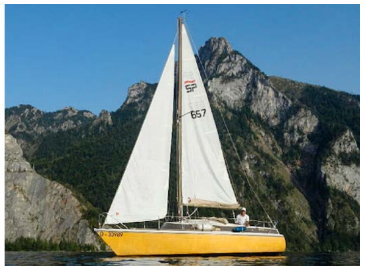
Eine Sprinta 70 (nicht unsere) in den Schären.