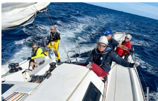
Zunächst wurde hart trainiert.

Siehe auch: www.ccszuerich.ch/de/events/info_Events_LesVoiles